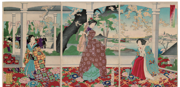
「舞踏會上野櫻花観遊ノ圖」(1887)