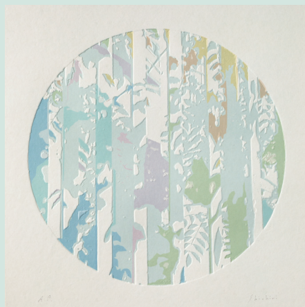
七里真代 〈Spectrum 2019〉