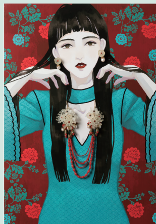
森眸美 〈オリエンタル〉