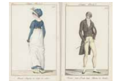
『Journal des dames et des modes』 「ジュルナル・デ・ダーム・エ・デ・モード」