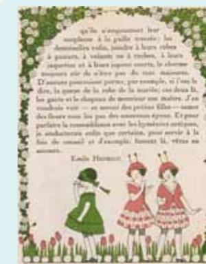
『Gazette du bon ton』 「ガゼット・デュ・ボン・トン」