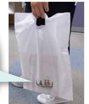
資料が濡れないように作ったビニール袋に、アーカイブ画像を使ったシールを貼っています。

この貴重書デジタルアーカイブの画像は、様々な出版物や学術論文の作成に利用されています。