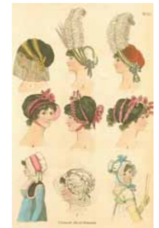
『The fashions of London & Paris』 「ロンドン及びパリの流行」