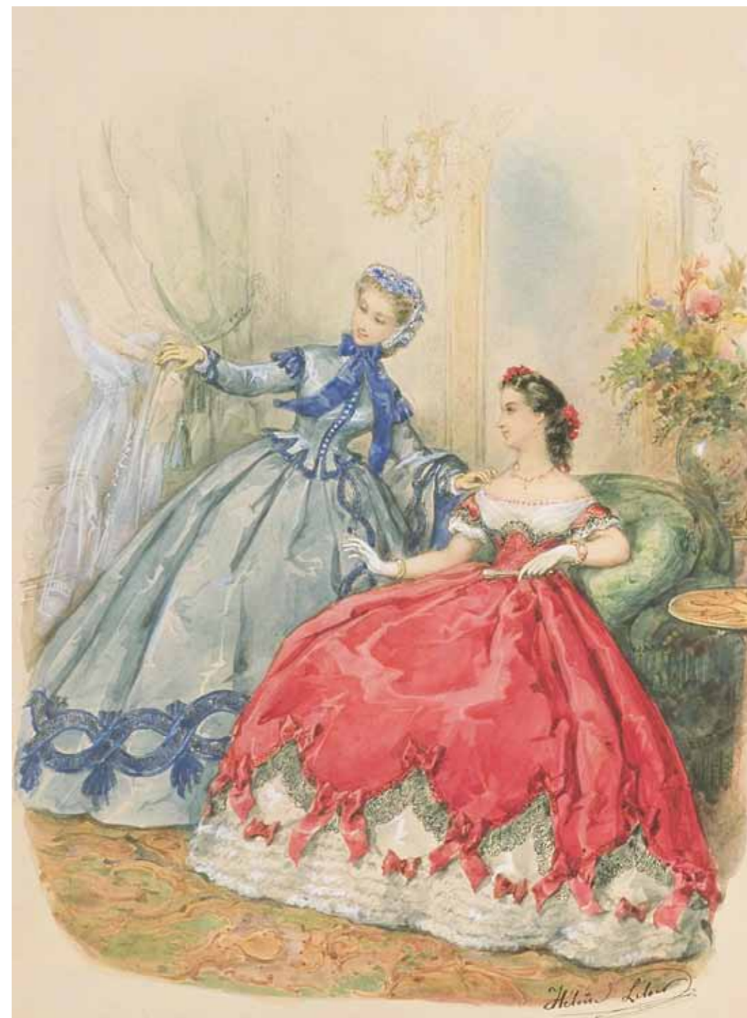
「Album de la mode illustrée」[アルバム・ドゥ・ラ・モード・イリュストレ]より