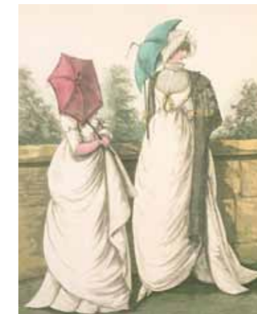
『Gallery of fashion』 「ギャラリー・オブ・ファッション」