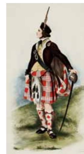
『The clans of the Scottish Highlands』 「スコットランド高地(ハイランズ)の氏族」