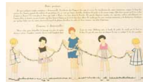
『Art-gout-beaute : feuillets de l'elegance feminine』 「アール・グー・ボーテ」